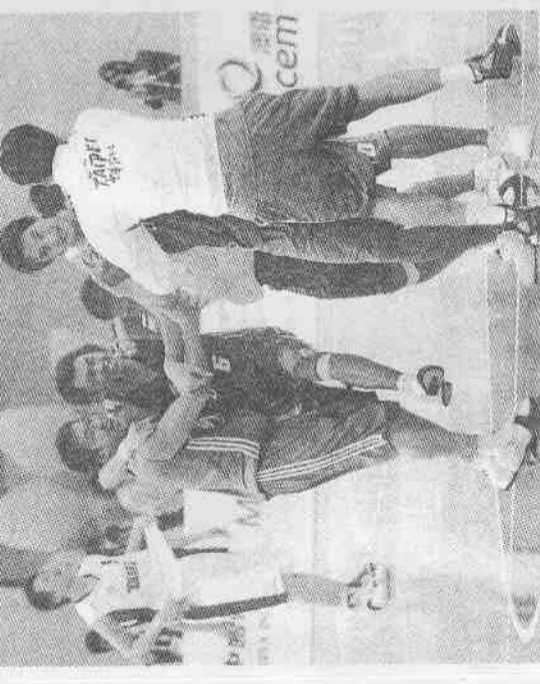
資料照片 記者趙文彬/攝影

↓11月初，澳門籃球場的中華男隊選手樂翻了，他們神奇地打敗大陸、韓、日奪得東亞盃金牌。