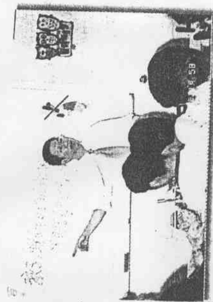
教育部有意修改讓教師資格改為檢定考試，但大學教育改革促進會有不同意見，要求教育部應修法。(資料照片)

據依作版正法修年83以 行進再會委法修組重法修暫停提決 疵瑕有位本長校斥充批會進促改教