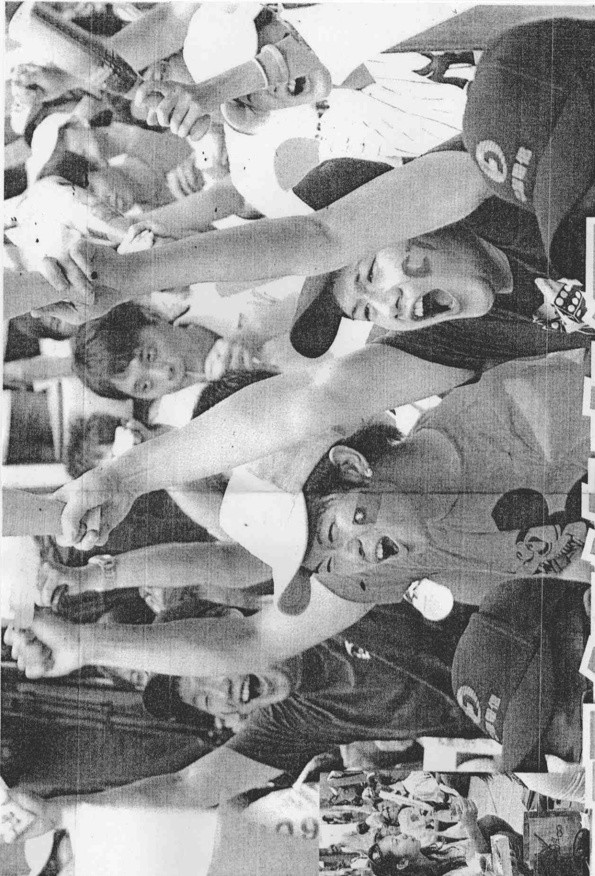
→在大螢幕現場為台灣隊加油的球迷，每當台灣隊有優異表現，就高舉雙手，大聲歡呼。 (記者方實照攝)