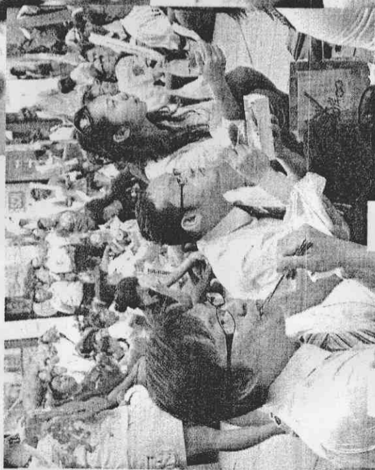
日比賽正逢午餐時間，許些球迷趁著休息空檔，趕到大轉播現場，為台灣隊加油。