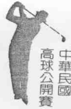
中華民國 高球公開賽