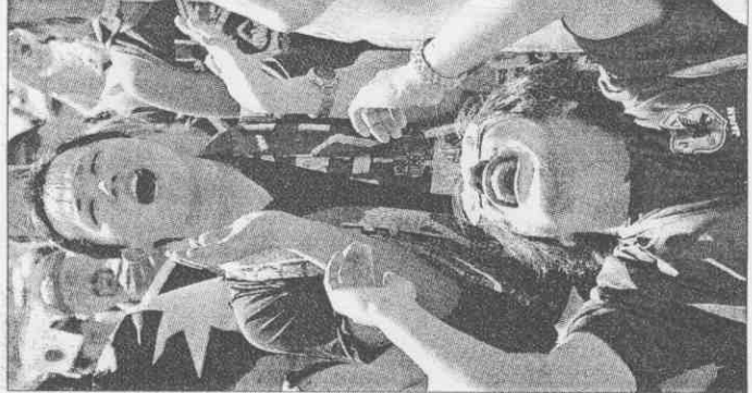
▲日本球迷看到澳洲足隊頻頻進球，一片哀號。