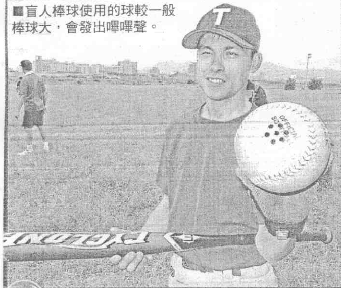
■盲人棒球使用的球較一般棒球大，會發出嗶嗶聲。