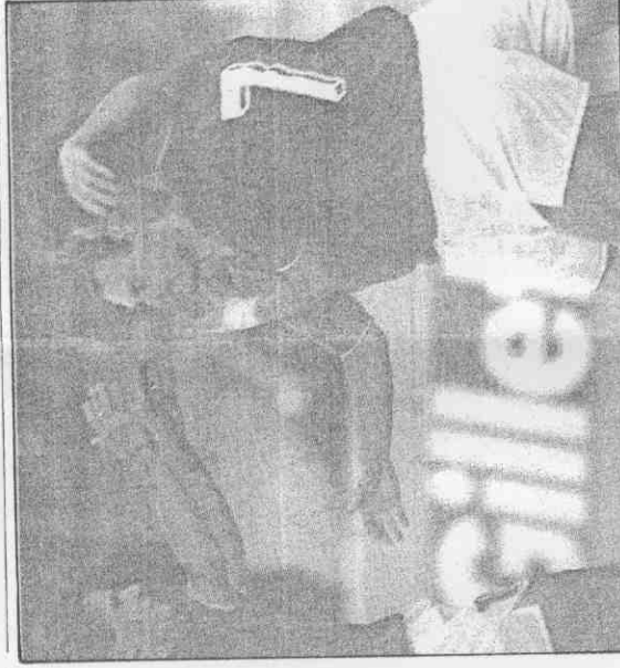
↑義大利中場巴吉歐(左)、前鋒希拉奇(中)與後衛馬爾迪尼在義大利2：1擊敗英格蘭，相互擁抱。