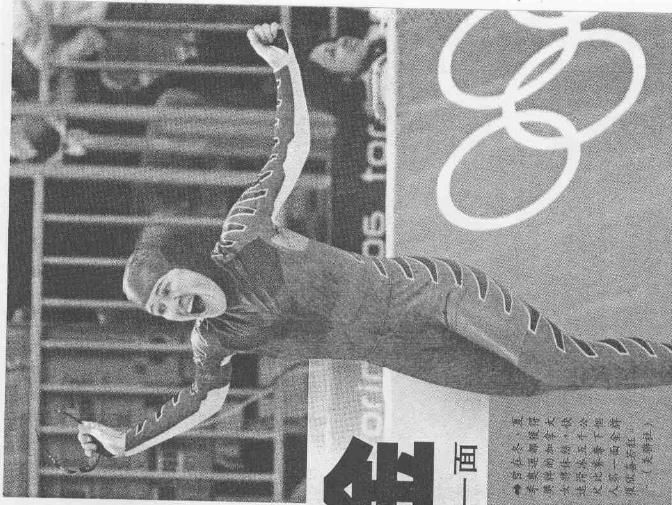
夏、冬奧運都獲得大獎牌的加拿大女將冰五子公比比在賽下個入第一面金牌慶祝。