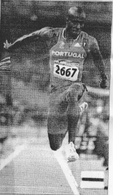
▲男子三級跳決賽，葡萄牙選手伊伏拉跳出17公尺67的今年個人最佳成績，順利奪下金牌。

另在男子三級跳決賽，葡萄牙選手伊伏拉跳出17公尺67的今年個人最佳成績，順利奪下金牌，英國的伊托吳以17公尺62拿下銀牌，銅牌是巴哈馬選手桑斯，成績為17公尺59。