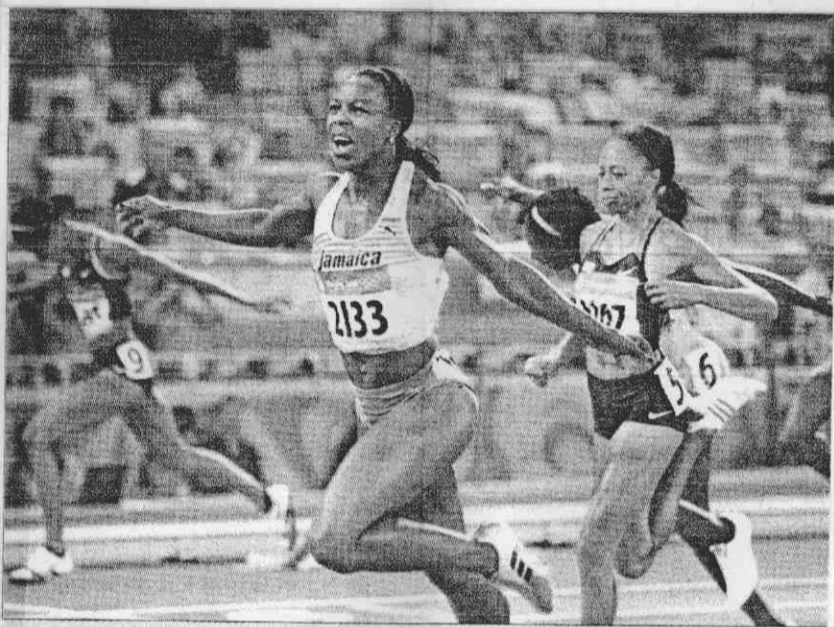
▲牙買加女將坎貝爾在兩百公尺競賽中一馬當先，率先衝過終點線摘下金牌。

巧的是，銀牌得主菲莉克絲在美國國內100公尺奧運國手選拔時也告落選，只能全力拚200公尺。沒想到再度不敵死對頭坎貝爾，也只能感嘆「既生瑜、何生亮」了！