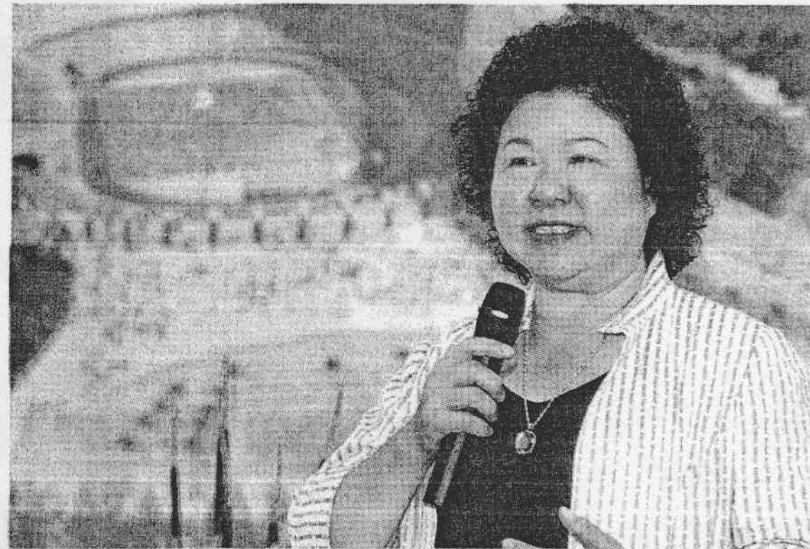
高雄市長陳菊對2009高雄世運的最大堅持就是「只許成功！」。

全球各大城市舉辦國際綜合賽事，無非為了提昇知名度與增加主辦國際活動的經驗；陳菊強調，有了「世運經驗」，已讓台灣、高雄在未來申辦國際賽事或活動多了一項資歷與機會，因此不論落幕後留下的是硬體還是軟體，這經驗將很寶貴。