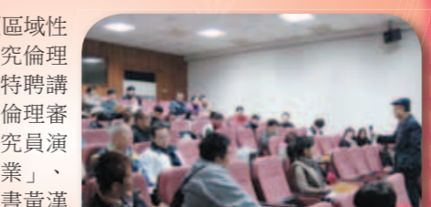
戴正德教授於聽眾席與師生互動