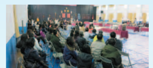
▲新春團拜與會教職員工