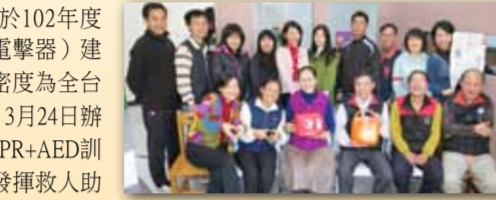
學務處同仁共同宣導建立校園安心場域