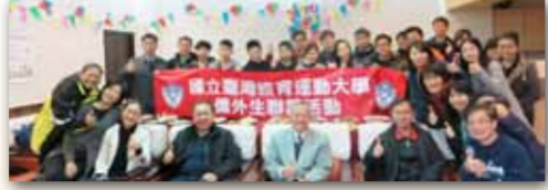
校長與僑外生及相關師長合影