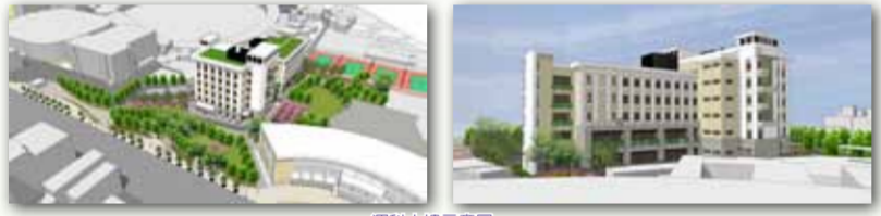
運動科學綜合大樓示意圖