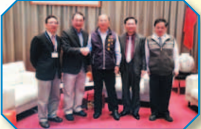
會後合影：左起教育局吳榕峯局長、林華章校長、胡志強市長、蔡炳坤副市長、建設局吳世璋局長

胡市長對本校在臺中市對於體育推廣、運動賽會及場館規劃提供協助表示感謝之意，並表示臺中市持續推動爭取2019東亞青年運動會在臺中市舉辦，屆時仍請本校提供專業協助。另林校長亦向市長表示本校代管原自來水公司借用之市有土地，基地上原有無使用執照之庫房設施有礙觀瞻，基於市府雙十文化流域及體二都市更新之規劃，建議市長予以拆除並全面綠美化，以配合放送局及水資源文化館之景觀，此建議獲得市長支持，並責成蔡副市長督導教育局(拆除工程)及建設局(綠美化工程)進行會勘與執行。