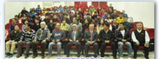
陳定雄教授與來賓合影