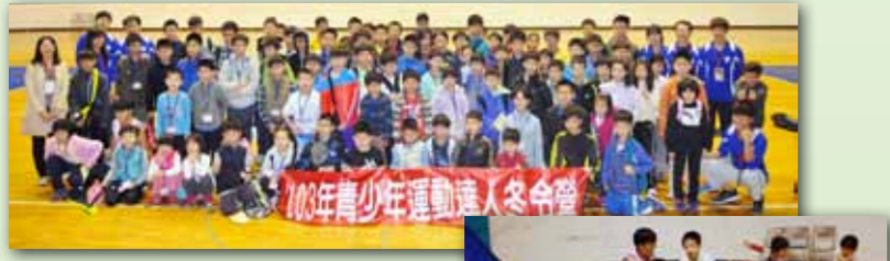
青少年運動冬令營學員暨工作人員大合照