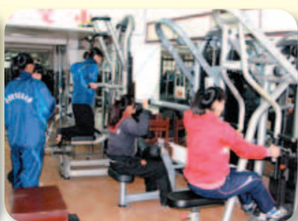
寒訓選手訓練情形