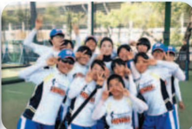
參觀本校打擊練習場弱影