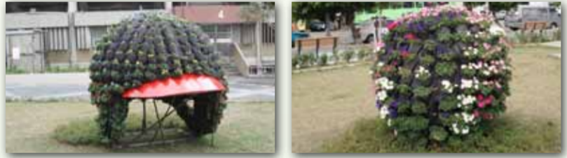
巨型棒球帽花卉相片