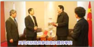
與大陸體育學院簽訂校際交流合約