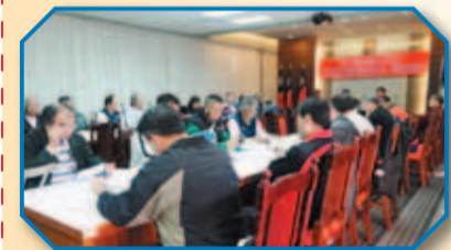
第7屆校友總會理監事與各縣市理事長商討議程

會後由林校長帶領與會人員校園巡禮，參觀技擊館及新教學大樓學術科場地，校友對運動訓練設施新穎完備稱讚不已，直呼這才是一所體育專業學府，辦理國際運動交流才有合宜的訓練及比賽場地，最後請校友移駕蘇杭小館餐敘，賓主盡歡圓滿結束。