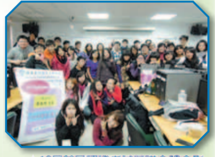
▲12月29日認證考試營隊全體合影

通識教育中心為提升學生多媒體應用技能，配合教師授課使用合法軟體，特辦理該軟體認證考試，並於102年12月12、19日舉辦教育訓練課程，同年12月28至29日舉辦認證考試營隊。