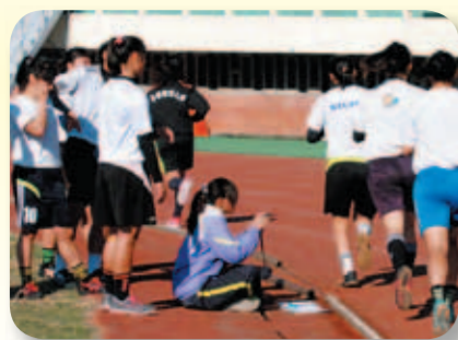
寒訓選手訓練情形

代表隊寒訓於1月13日至2月14日假各場地舉行，總計有田徑、游泳、自由車等22種類，共計726名選手參加。