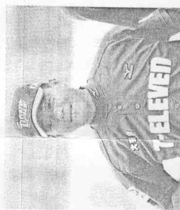
現職：統一獅隊投手教練