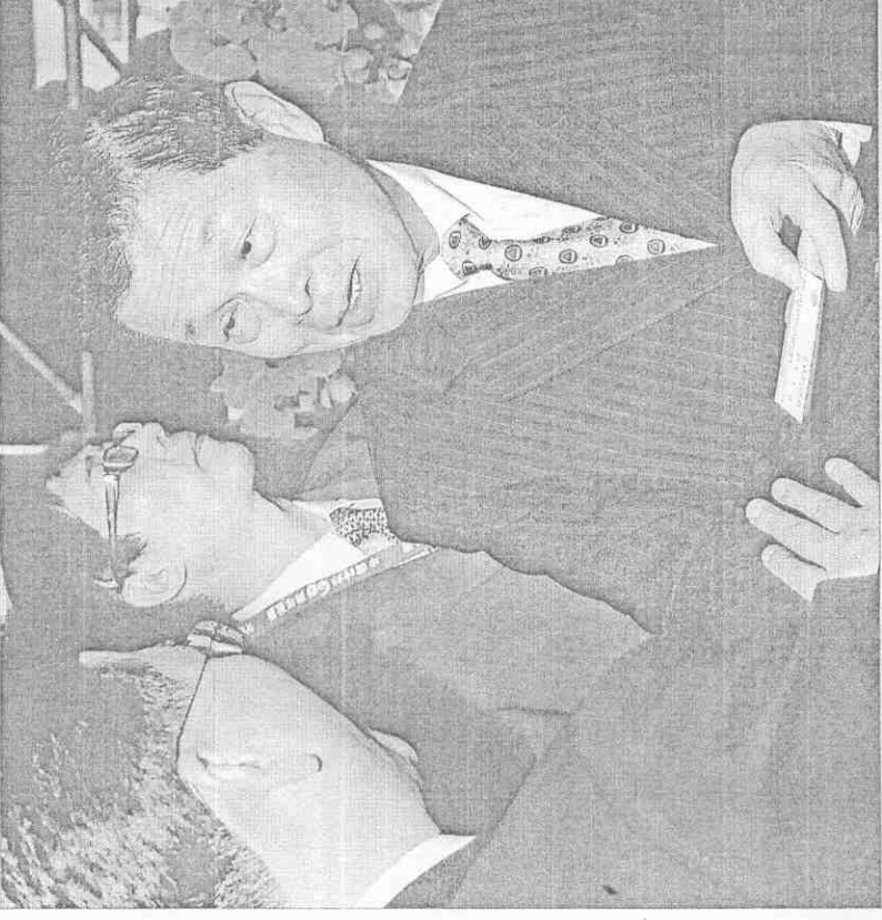
▲中國時報60周年社慶酒會，中華職棒大聯盟會長趙守博（右）親臨致賀。