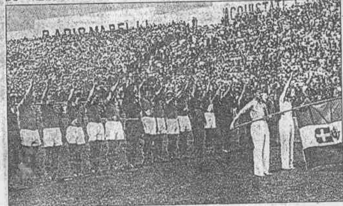
↑一九三四年義大利首次辦世界杯賽，充滿法西斯主義政治色彩。

墨索里尼勢在必得的心態，左右裁判硬把碰到義大利的對手給吹輸，尤以八強複賽對西班牙，義大利場上粗魯的動作均未遭比利時籍裁判處置，義