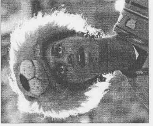
大帽 小帽 高帽 花帽 比看頭