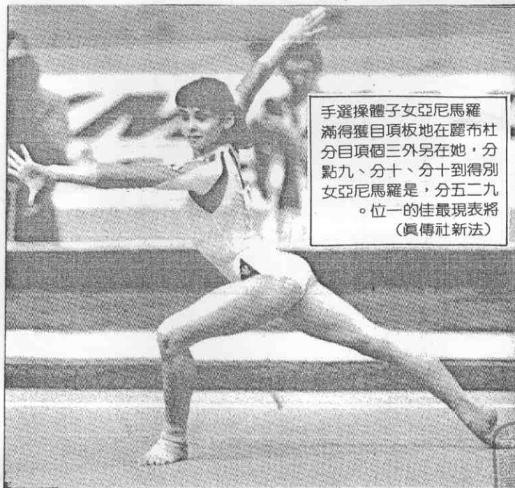
手選操體子女亞尼馬羅 滿得獲目頂板地在躍布杜 分目頂個三外另在她，分 點九、分十、分十到得別 女亞尼馬羅是，分五二九 。位一的佳最現表將 (真傳社新法)