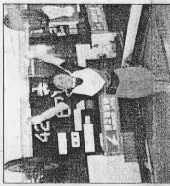
中全重者國加舉重葦綾參亞(記者蔡文居翻攝)陳葦綾即期年國比蔡文居翻攝