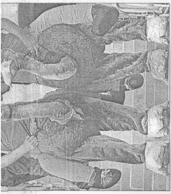
▲荷蘭球迷穿上傳統橘色T恤，下半身搭配特別設計的駝鳥裝，引來不少關注眼光。