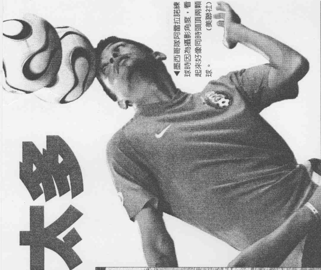
◀墨西哥隊阿雷拉諾球時因為攝影角度，看起來好像同時頭頂兩顆球。