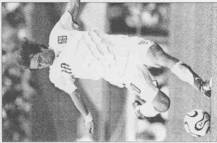
▲捷克中場洛西奇冷箭突出，以閃電般速度射門，為捷克取得開場勝。