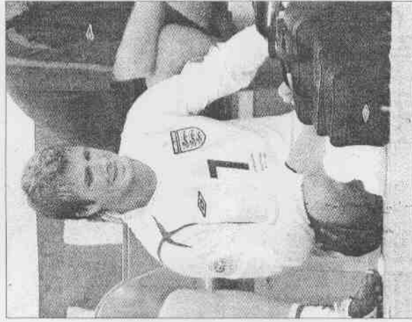
▲貝克漢在對葡之戰，下半場進行不久就被換下休息。