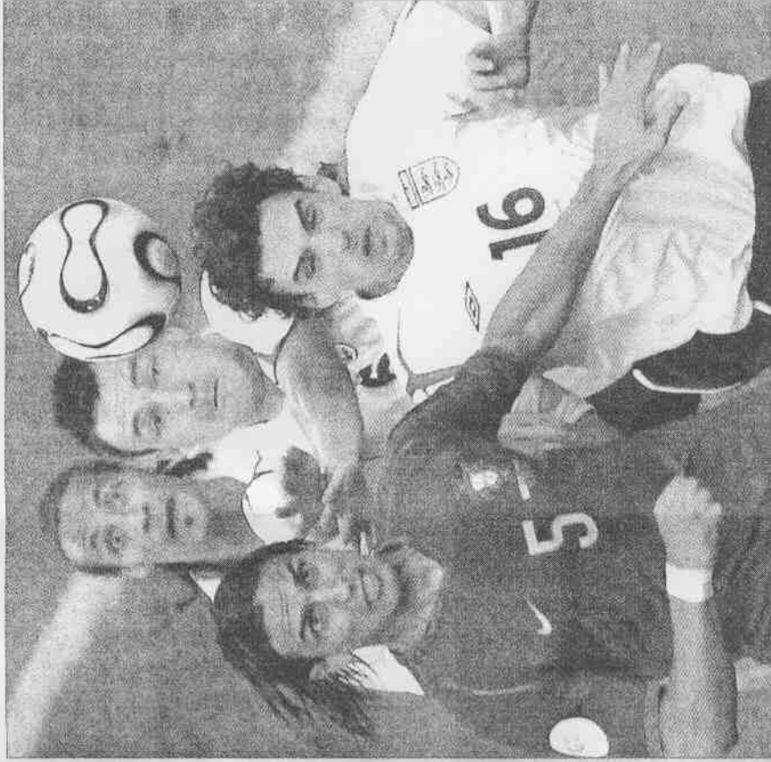
▲葡萄牙梅拉(左)和三位英格蘭球員費迪南德(右)、泰瑞和哈格里夫斯(後)，相互爭球。(法新社)

斯科拉里在四年前率領巴西隊七戰七勝，登上世足賽王座。後來轉往葡萄牙隊執教，拿下前年歐洲盃亞軍；而這兩次大賽，艾瑞克森都成了他的手下敗將。本屆世足賽到十六強賽為止，斯科拉里累計十一連勝，史上無人能及。而沈默穩健的艾瑞克森與熱情激昂的斯科拉里二度對陣，又是另一個注目的焦點。