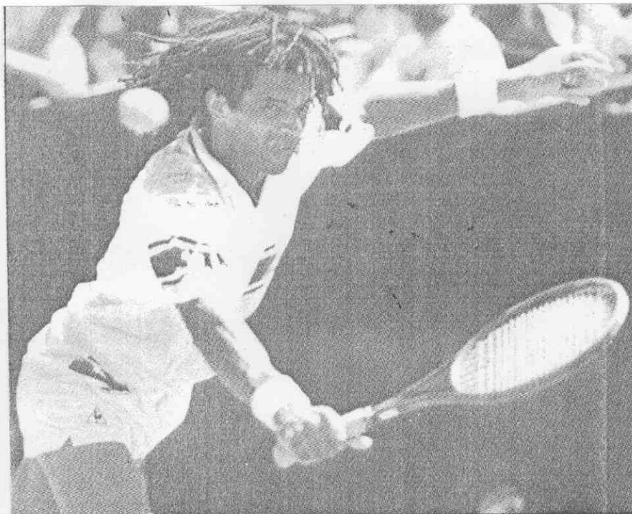
▲法國選手諾亞，廿七日在立普頓網球賽男子單打，以六比四、三比六、六比四、二比六及七比五擊敗瑞士選手拉塞克，晉級八強。