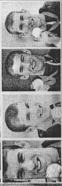
圖為北京奧運金牌得主菲爾普斯、雷札克、羅格、拉婷娜、史畢茲。