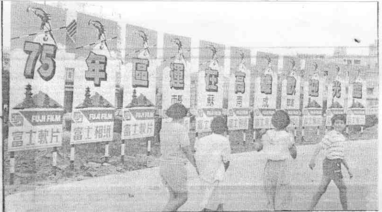
▽▷高雄市處處可見區運標誌、招牌。