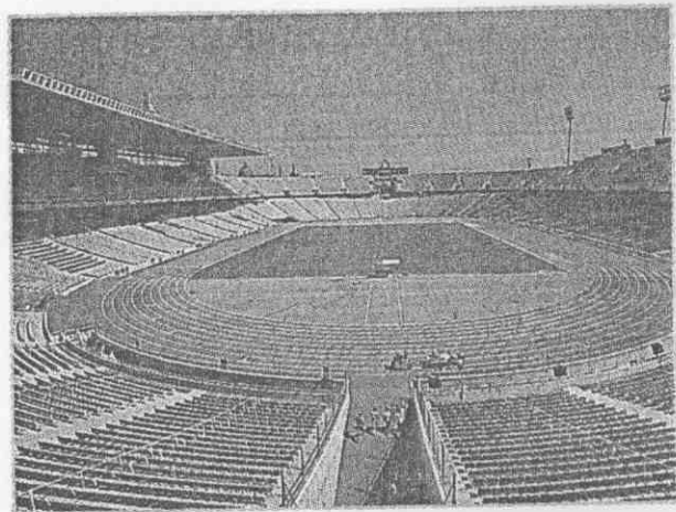
↑奧運主場地將舉行盛大的開閉幕儀式。

本報為幫助讀者了解巴塞隆納奧運，從今天起推出系列報導，介紹奧運籌備情形，主要比賽場地、巴塞隆納市概況，並教導讀者明年如何赴現場觀賞比賽及觀光。