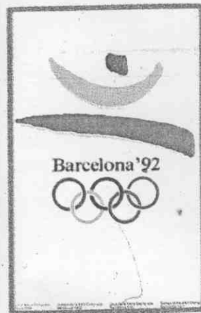
↑巴塞隆納奧運標誌動感十足，簡單3筆勾出在跑步的人形。