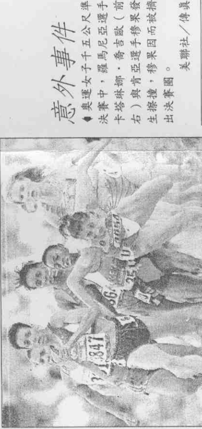
意外事件 ◆奧運女子一千五百公尺準決賽中，羅馬尼亞裔吉歐(前右)與肯亞選手穆果(後右)相撞，穆果因而被擠出生擦撞，穆果因而被擠出生擦撞。

奧運採訪團記者 鄭清煌 / 亞特蘭大一日專電 ●奧運女子一千五百公尺準決賽昨天的「事故」激烈，衛冕的阿爾及利亞名將波莫卡因與人相撞，再抓下另一名選手的背號後摔倒，坐失晉級資格；另一組的競賽中，則發生有選手因重心不穩，差點拉下另一人短褲的情形。 美國上次主辦洛杉磯奧運會時，曾發生三千公尺決賽被看好的美國選手戴寇兒，和以英國名義出賽的南非小將芭德，兩人在比賽時因都想超越對方，而踩到對方的腳，戴寇兒踉蹌倒地痛失得牌機會。 事隔十二年後的亞特蘭大奧運會，歷史居然重演於女子一千五百公尺的準決賽，只是這次主角換成上屆冠軍阿爾及利亞的波莫卡，於第三圈試圖從集團中衝出時，因而絆上羅馬尼亞史札波夫的腳，情急中抓下史札波夫的背號，接著又被波蘭的內茲推了一把，順勢跑到外側跑道，但仍已來不及追上，從領先地位落到最後一名，經向大會投訴無效，含恨而返。 波莫卡在上屆奧運會得金後，頓時成為阿爾及利亞的民族英雄，但今年參賽，並未特別看好，昨天波莫卡與內茲最後都晉級決賽。波莫卡與內茲最後都晉級決賽。 接著是肯亞男子長跑獨步全球後，準備拓展勢到女子組的希望穆果，被英、美、澳等西方選手夾擊，鞋子被踩掉而摔倒，但是馬上爬起來一跛一跛地再往前衝，奮戰精神令人同情。