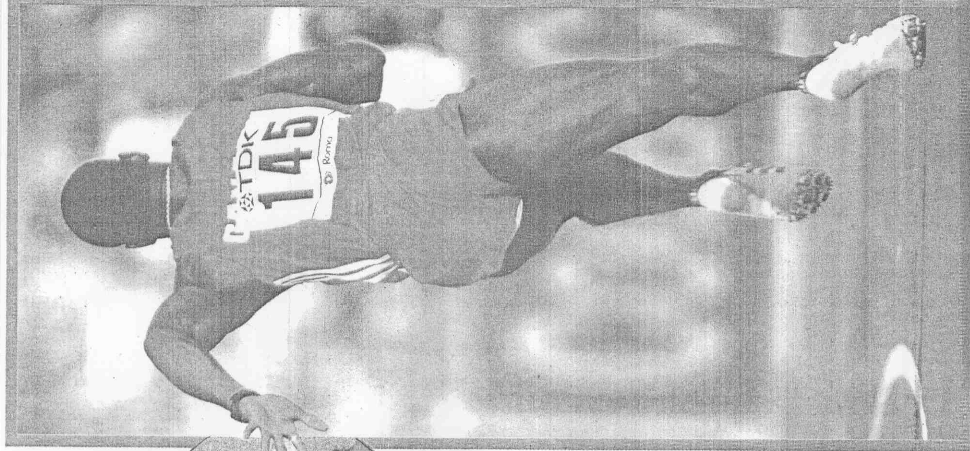
(「影攝運全」用採獨報本)·了見再，生強↑

● 廿七日上午踏進奧運新聞中心， 一股凝重壓抑的氣息迎面撲來。 佔地近兩百坪的工作間裡，數百位 記者手忙腳亂的敲著打字機，大家臉 上都沒什麼笑意。