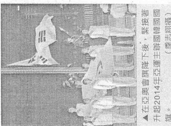
▲在亞運會旗降下後，緊接著 升起2014年亞運主辦國韓國國 旗。(李志翔攝)