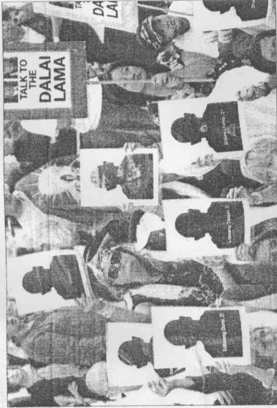
▲「國際支援西藏網絡」組織3月31日在澳洲雪梨舉辦西藏活動。示威者舉著空白照片象徵遭鎮壓死傷者，他們要求奧運聖火不要行經西藏。