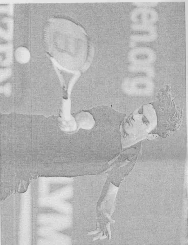
▲球王費德勒擊退瑞典的索德林，順利挺進男單4強。