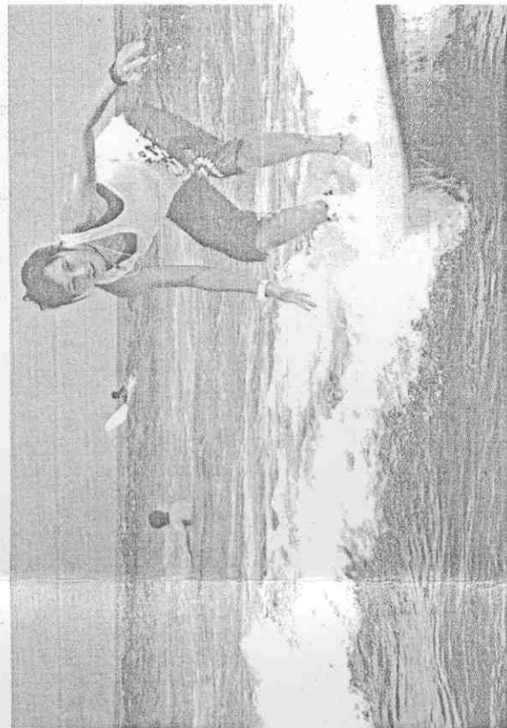
■鄭韶婕比賽之餘最愛藉由衝浪調整身心。

2004年，18歲的鄭韶婕拿到世界青少年羽球錦標賽金牌，創下羽球史上新猷；2005年她再獲世界錦標賽女單銅牌，將羽球生涯推向巔峰。2008年北京奧運，鄭韶婕被看好是奪牌重心人物，沒想到在首輪遭中國好手謝杏芳以1比21、9比21痛宰，自此她的人生步入最黑暗期。