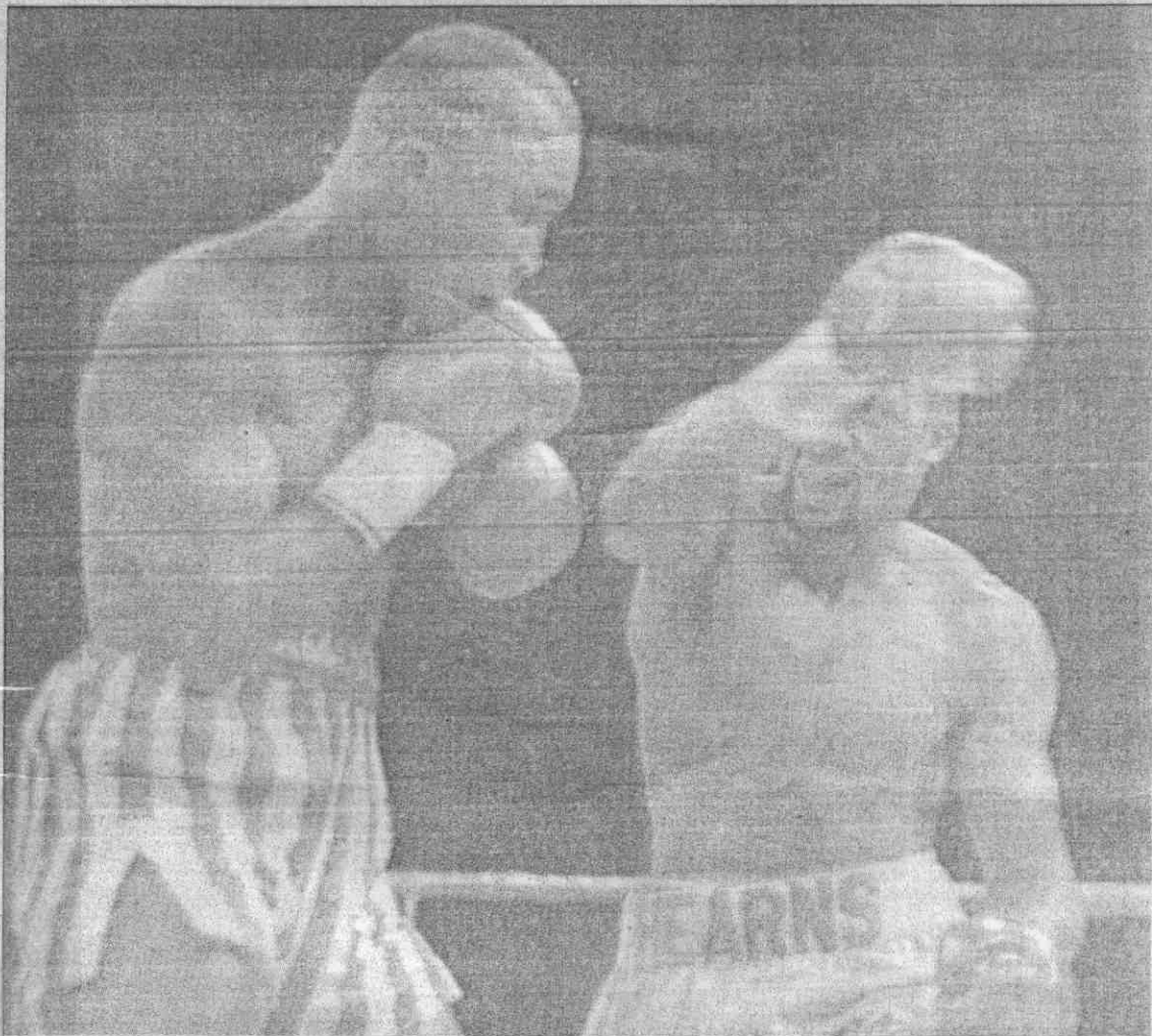
（真傳社聯美）。濺四珠汗的部頭德納李，時（左）德納李中擊合回二十第於（右）斯恩希↑

【美聯社拉斯維加斯十三日電】「蜜糖」李德納十三日在拉斯維加斯凱撒宮和「打手」希恩斯激戰十二回合後，戰成平手，算李德納成功衛冕他的世界拳擊理事會（WBC）超中量級冠軍。 卅三歲的李德納曾在九八年九月十六日的輕中量級拳王爭霸賽中，於第十四回合擊倒希恩斯。不過，此次的比賽和他們前次交手時的情況已完全不同。兩人不但老了八歲，且都重了八、九公斤。 這場拳賽中，李德納曾在第三回合和第十一回合中，被希恩斯擊倒，但即時站起重新應戰；不過，他在最後一回合的後兩分鐘一輪猛攻，獲得不少分，因此得以扳回失分，和希恩斯戰成平手。 第三回合時，希恩斯以一記右拳擊中李德納頭側，使李德納倒在地上。第十一回合時，希恩斯以三記連續右拳打中李德納頭部，再次使李德納倒地。