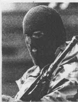
911事件影響雅典奧運會，恐怖份子是否會襲擊奧運會，奪取許多人心惶惶不已。

對於雅典奧運會百年紀念，已屆滿百日的開幕式，定於8月24日，由希臘總理卡拉曼利基主持。 （本報社）