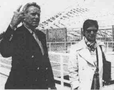
國際奧委會主席薩馬蘭奇與希臘總理卡拉曼利基（左）在雅典奧運會開幕式上。