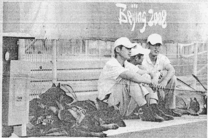
▲京奧各項安全維護工作日趨吃重，連保安警犬也累得趴在一旁休息。