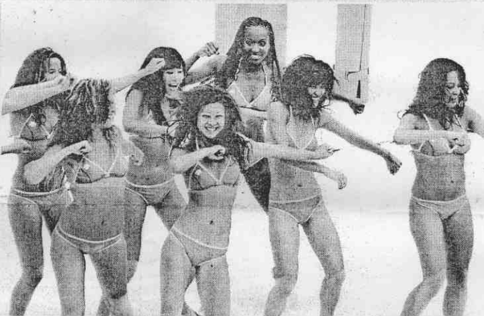
▲在悶熱的八月天裏，沙灘排球場上卻清涼有勁，比基尼女郎隨著音樂舞動彩排。