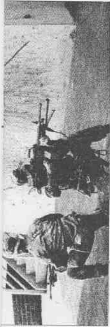
▲谷關陸軍特戰訓練中心是國軍特種部隊的訓練場地，素以嚴謹聞名。