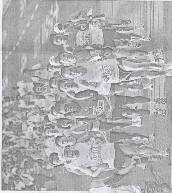
▲ING台北馬拉松路跑，締造了年年破10萬參與人數的世界紀錄。(本報資料照片/陳怡詠攝) (本報資料照片) (本報資料照片)