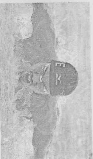
■許志傑是我國唯一曾晉級奧運準決賽的選手。資料照片