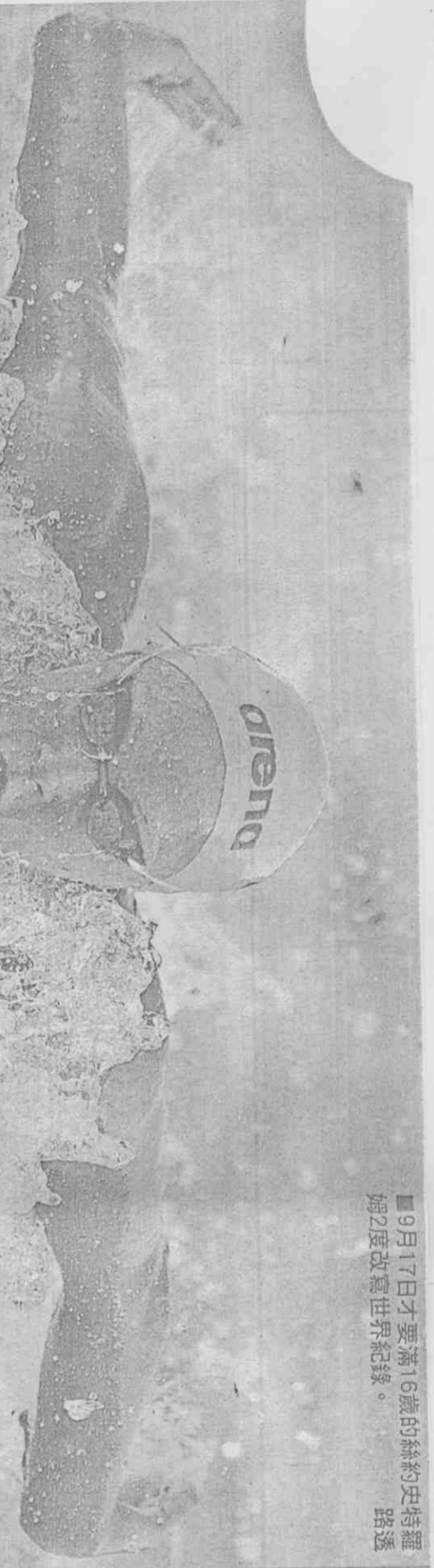
■9月17日才要滿16歲的絲約史特羅姆2度改寫世界紀錄。