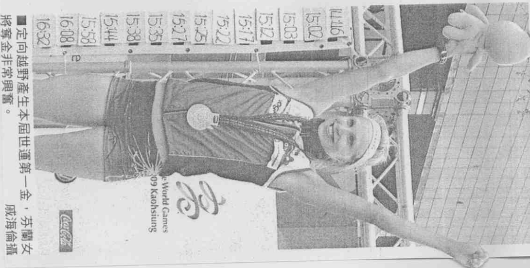
定向越野產生本屆世運第一金，芬蘭女將奪金非常興奮。