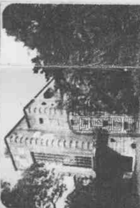
台北巨蛋屋頂未來將採可開關式或封閉式，目前尚未決定。