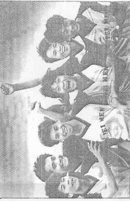
全國中正杯高男足賽，北門在蟬聯冠軍 後球員歡呼勝利。