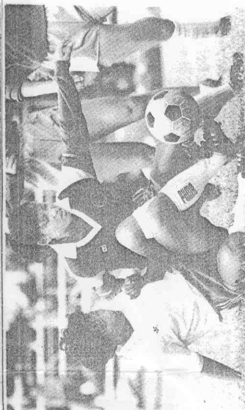
球爭讓相不互上地在坐將女寧宜與(左)傳銘，一之戰鍵開女高。