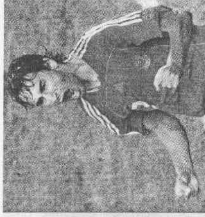
這些備胎 關鍵進球