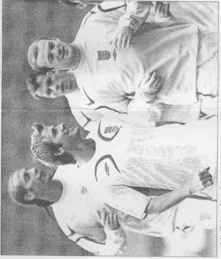
英格蘭今天在世界杯足球賽出戰瑞典隊，爭奪B組分組冠軍，昨天隊長貝克漢（左）及小將魯尼（右）都神情輕鬆地進行訓練。

魯尼已近7周未出賽，埃帥說：「我認為他對瑞典隊時會更犀利。」直逼歐文的「越來越好」。