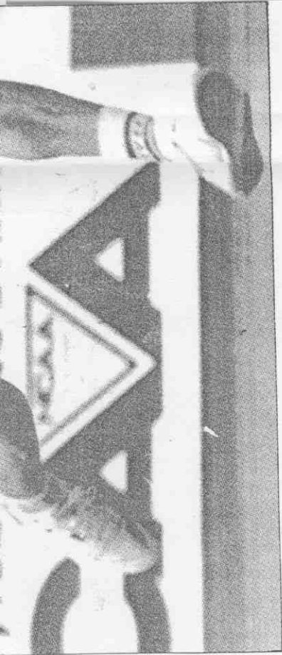
↑今年全英羽球公開賽單打冠軍大陸隊趙劍華，出戰南韓時小試身手，輕取崔相範。 特派記者 郭運復 / 名古屋傳真