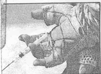
選手不可亂注射藥物。

●亞洲女子健美賽昨天在台北登場。依規定，選手必須在賽前接受藥物檢查，但國內在這方面的檢驗設備與技術不夠，於是檢