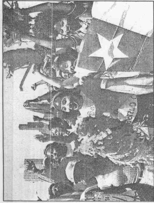
↑玻利維亞球迷，在玻隊出戰西班牙的比賽開打之前，在場外搖旗吶喊，為玻隊加油助陣。