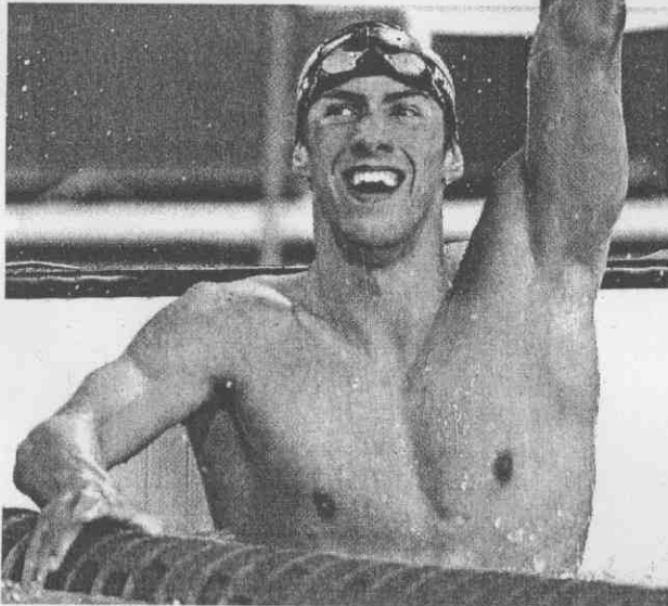
▲菲爾普斯高舉雙臂，發出勝利的歡呼。