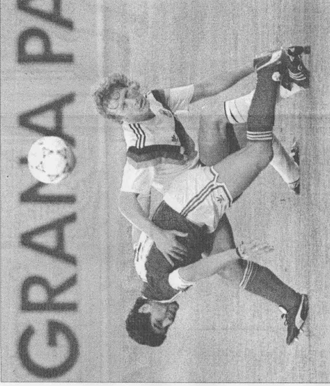
德阿戰，1990那一役 這是1990年世界杯足球賽在義大利舉行時，德國與阿根廷進行冠軍決賽的狀況，阿根廷馬拉度納（左）與德國的赫瓦爾斯貝格爭球的鏡頭，德國與阿根廷今晚又要在世足賽碰頭，不過這回不是決賽，而是8強賽。