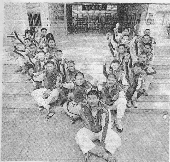
↑以剃光頭宣誓復仇決心的開南商工，今年中正杯果然如願抱走高男組冠軍杯。

無緣人，僅曾於第11屆奪得一次高男組冠軍，其後已多年未曾再嘗勝利滋味，去年程國峰積極厲兵秣馬，企盼能重新奪回睽違4年的冠軍杯，卻仍在最後關頭敗下陣來，與冠軍擦肩而過，總教頭程國峰當場淌下英雄淚。