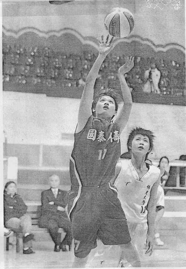
國泰人壽女籃隊已是國內十多年來最強女籃隊，但卻一直缺乏經營觀眾的人氣凝聚力，所以每年冠軍賽都是在冷清場面中默默封后，令國泰高層大失所望。

【記者陳念祖台北報導】亞洲籃球總會日前收回中華民國籃球協會的第23屆亞洲女籃錦標賽主辦權，女籃亞錦賽將另尋舉辦城市，賽期和地點將另行公佈。據報導，中國極有可能被要求承辦這一比賽。