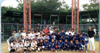
女子壘球隊與香港國家代表隊合影

本校女子壘球隊為提升競技水準，強化個人技術及國際比賽經驗，特別利用今年暑期集訓期間（自7月21日起至8月10日止），赴香港及韓國訓練比賽，並參加國際女子壘球邀請賽。於香港訓練期間由本校女壘隊與其國家代表隊進行二場比賽；韓國邀請賽則有日本、韓國及本國（本校）計三國五隊進行交流比賽。其中日本由城西大學（JOSAI）組隊參加，韓國由尚智大學及Gyeongnam隊、Daegu隊二支俱樂部社會隊伍參加。經過激烈的爭戰後，本校勇奪今年度國際女子壘球邀請賽之季軍。