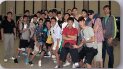
男子籃球隊移地訓練師生合影

此次移地訓練除了提升選手籃球專業技術觀念外，球員對於菲律賓的球風、身體上的對抗都有更進一步的認識與了解，相信未來訓練與比賽球員們都會有更加優異的表現。