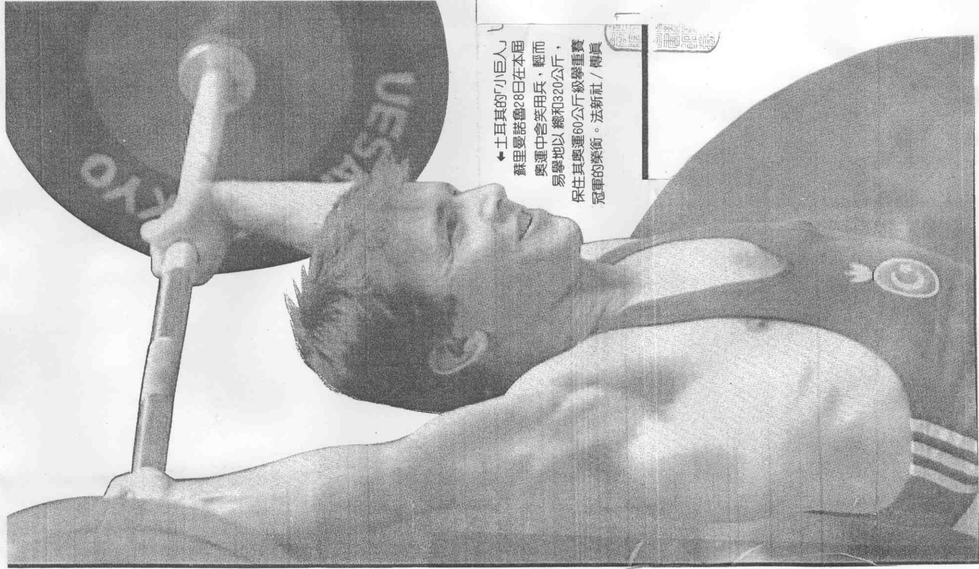
←土耳其的「小巨人」蘇里曼諾魯28日在本屆奧運中含笑用兵，輕而易舉地以總和320公斤，保住其奧運60公斤級舉重賽冠軍的榮譽。